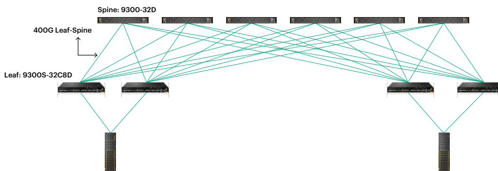
Figura 1. Distribuzione leaf-spine 400G

VXLANsec è ideale per le soluzioni DCI EVPN, con l'estensione dei servizi di livello 2 e 3 tra i data center. IPsec ad alta velocità consente l'interconnessione sicura di filiali e sedi centrali. MACSEC assicura la crittografia punto a punto all'interno del campus o del data center. La flessibilità di CX 9300S-32C8D garantisce che ciascuno di questi aspetti possa essere gestito all'interno di un'unica piattaforma di switch, tenendo conto di fattori quali throughput e topologia.